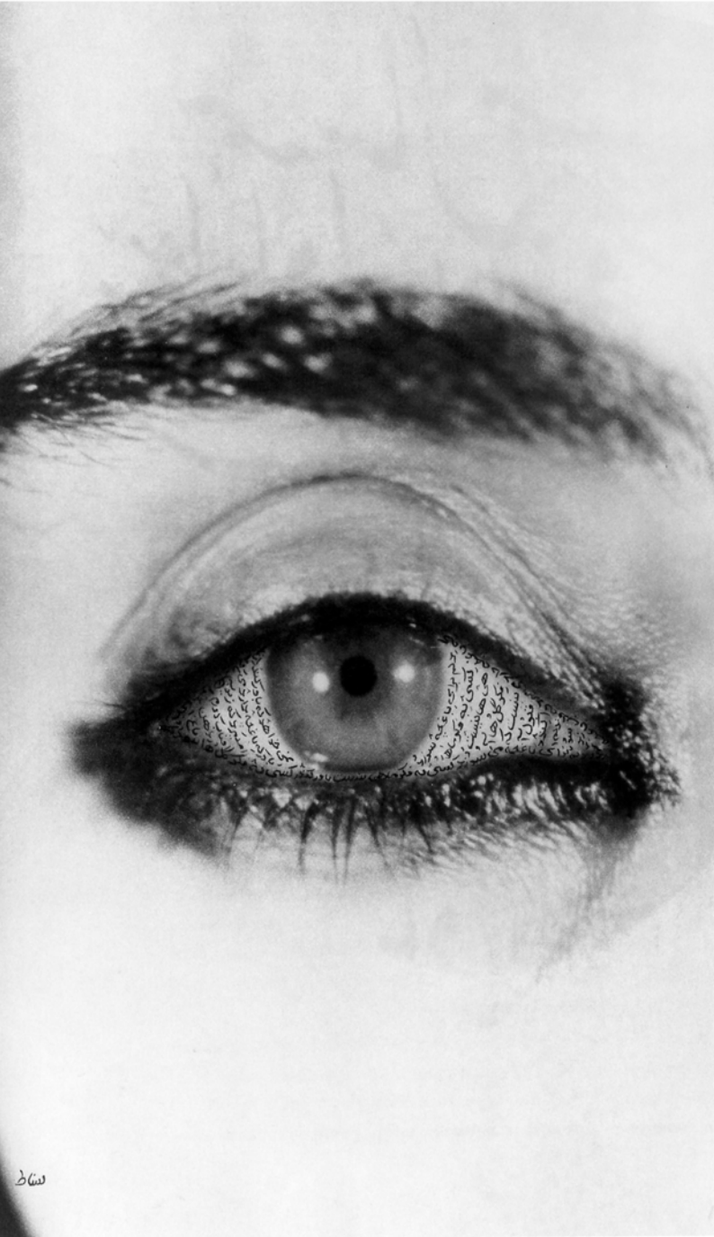
Shirin Neshat, Offered eyes

Εθνικόν και Καποδιστριακόν Πανεπιστήμιον Αθηνών